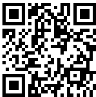
Linea 10 e S